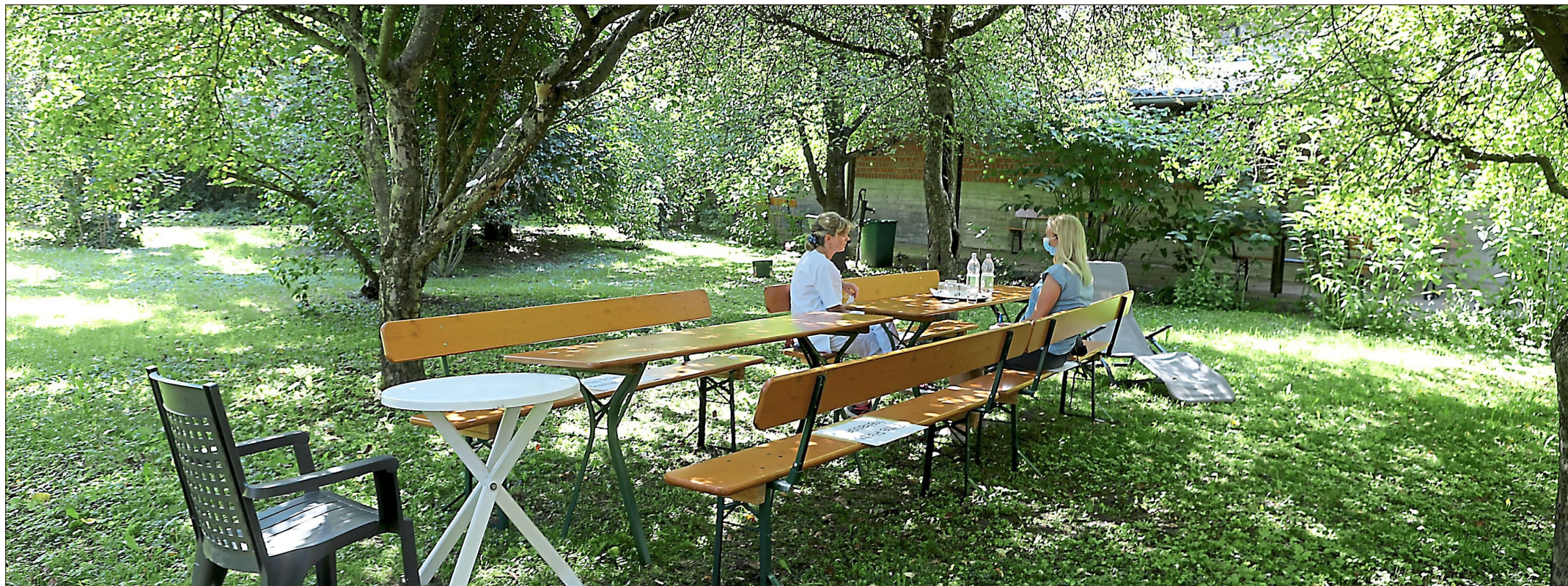
Mit Maske im Freien und auf Abstand – auch beim Gespräch mit unserer Reporterin waren die Hygieneregeln streng.